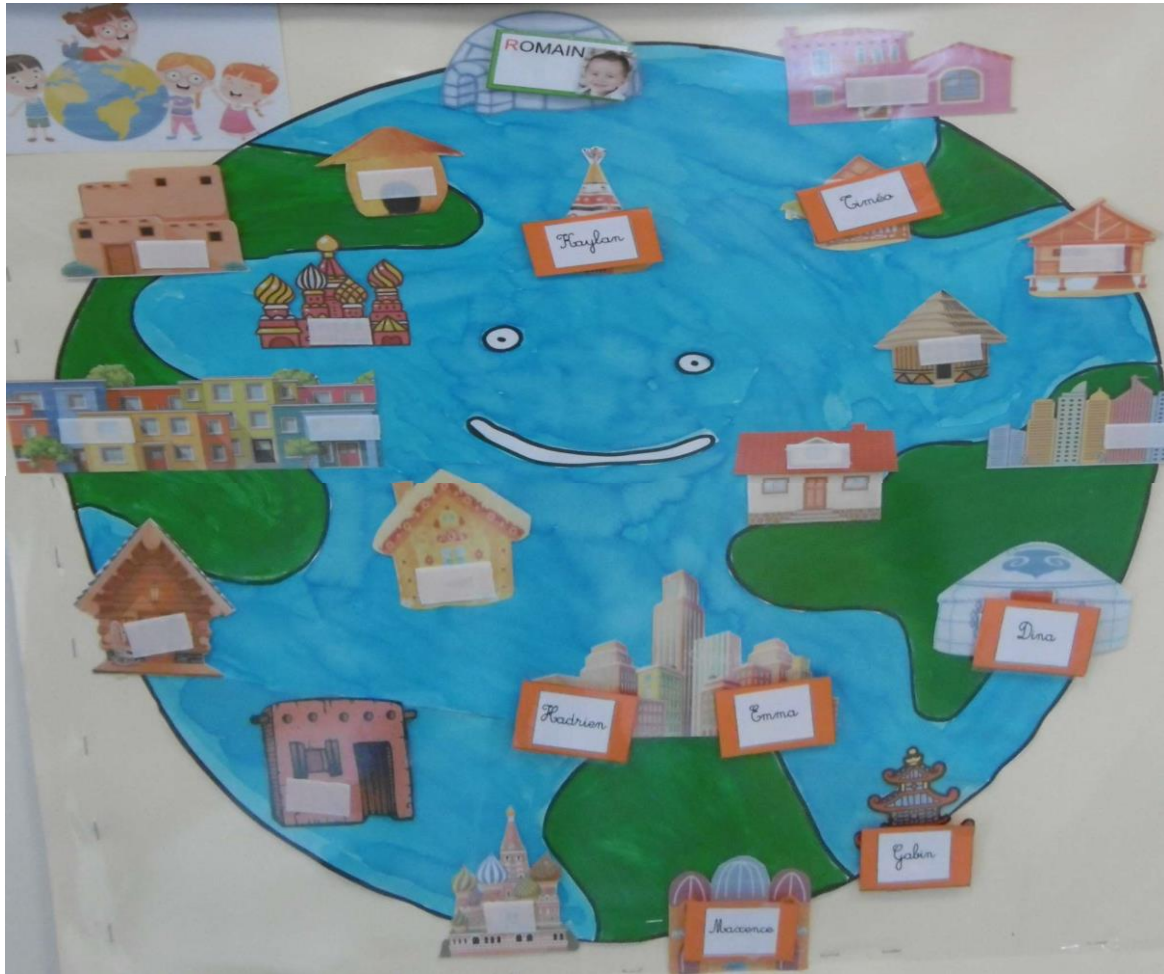
Le tour du monde par la classe de maternelle