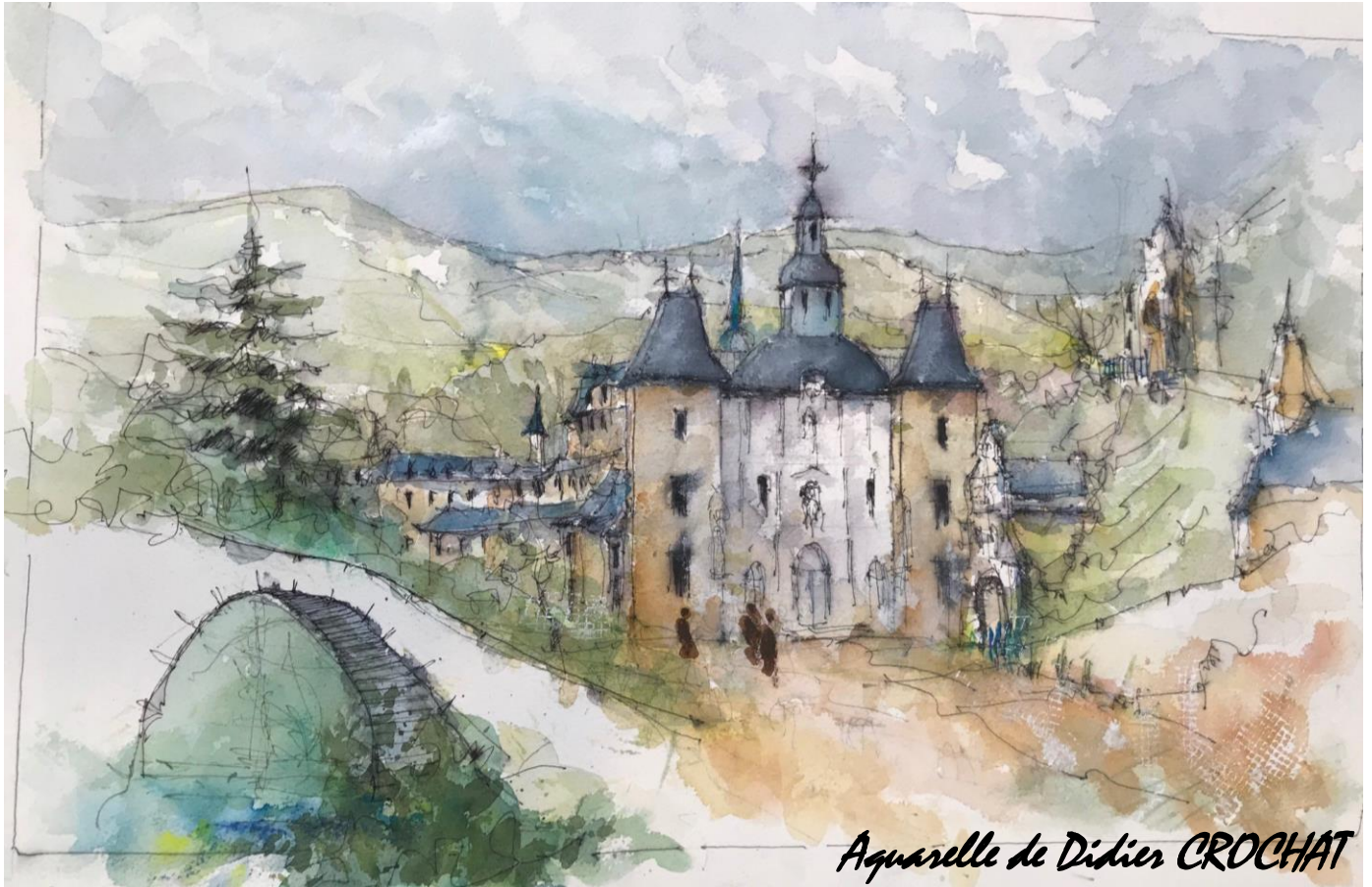
Aquarelle de Didier CROCHAT