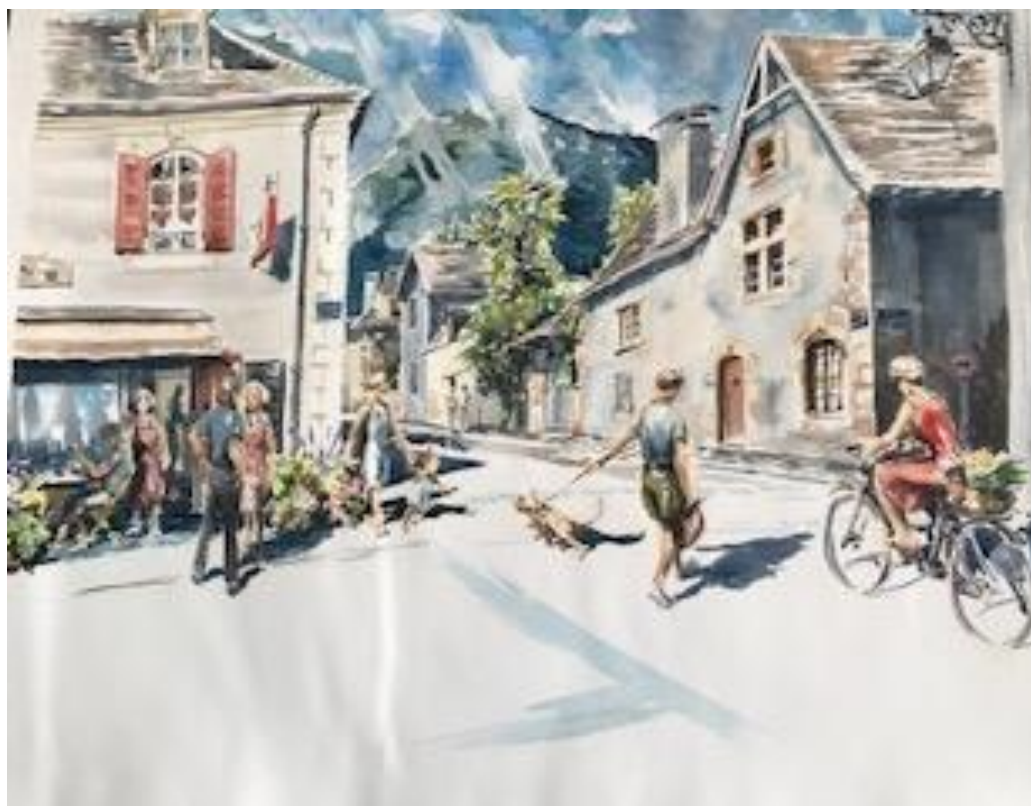
Aquarelle de Laurent Abadie, gagnant du concours « Peindre en bastide 2022 »