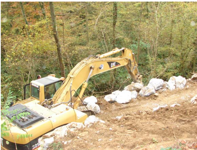
Un travail d'enrochement exécuté rapidement

L'entreprise Lapédagne qui remportait le marché, s'est mise au travail très rapidement. Malgré l'étroitesse des lieux, l'enrochement nécessaire à la réalisation de ce travail, délicat étant donné les difficultés d'accessibilité était réalisé de fort belle façon grâce à un pellicier de talent. La réfection proprement dite de la chaussée est programmée pour les prochaines semaines. .