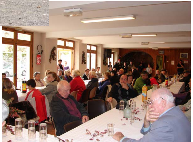
Lors de l'apéritif, salle de l'Isarce