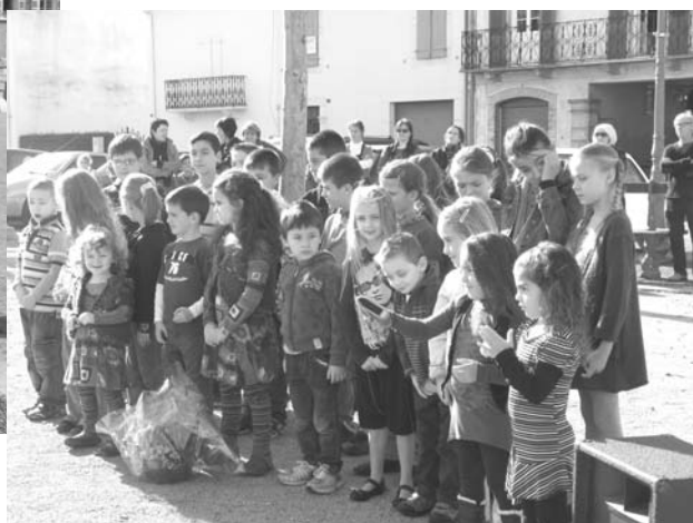
Les enfants de l'école communale ont interprété une vibrante Marseillaise