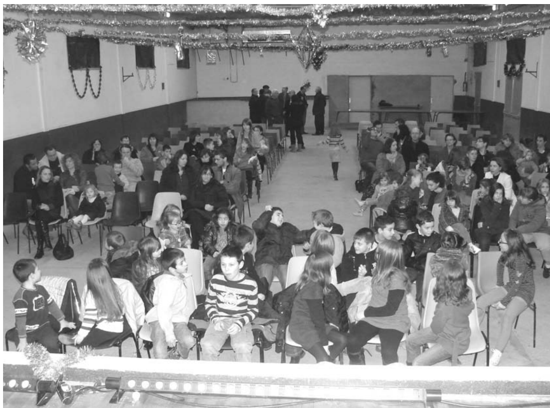
Les enfants des premiers rangs

Après quoi, l'inusable Père Noël, distribuait les cadeaux aux 92 enfants de la Commune.