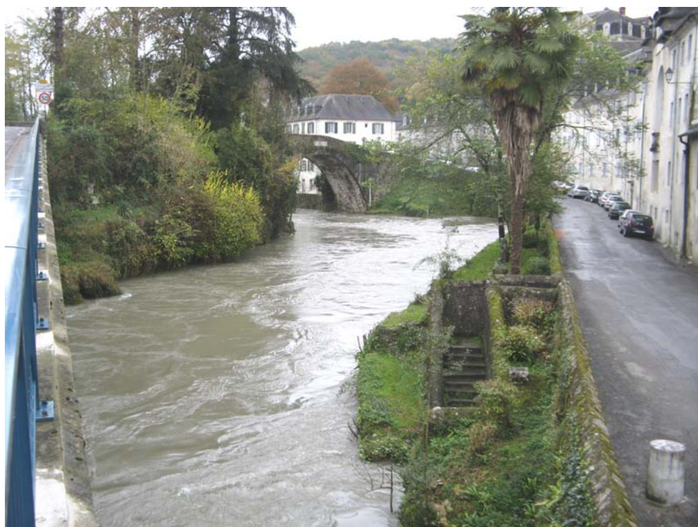
Le Gave en crue