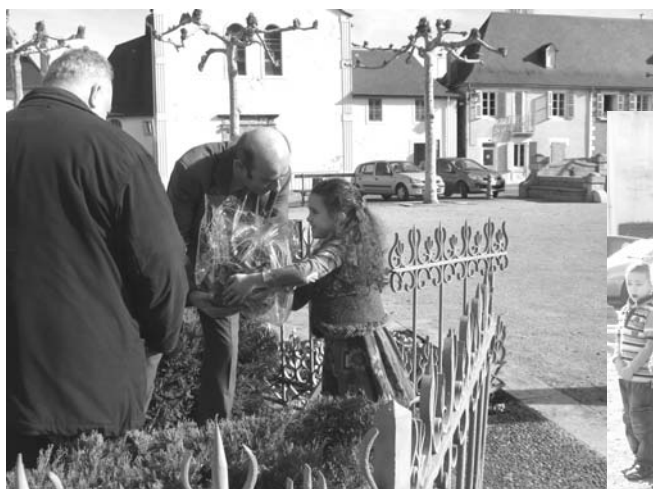
Dépôt de gerbe...et de bouquet