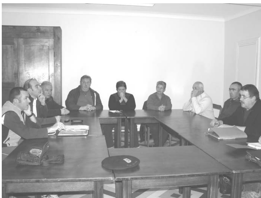
Les dirigeants anciens et nouveaux