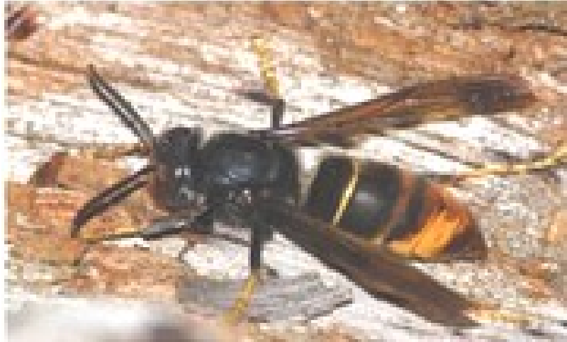
Une dominante noire - un seul anneau jaune orangé